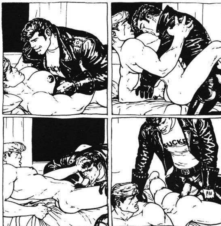
(König, detalle de viñetas, 1997 [1988]: 7)

Esta obra es un ejemplo paradigmático del uso de Tom de Finlandia (y sus imágenes) 9 como ícono en el proyecto creador de Ralf König. 10 Las imágenes de Tom de Finlandia son un elemento transcultural para el modelo gay, ya que se encuentran una y otra vez en representaciones culturales vinculadas a las sexualidades disidentes en espacios geopolíticos muy diversos (por ejemplo en Eduardo Mendicutti y Cesar Aira.). En el caso de König, la primera página de Safere Zeiten se abre con una serie de imágenes de Tom de Finland: