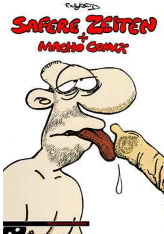
(König, 1997 [1988]: tapa) 8

Safere Zeiten (1988) 7 constituye una intervención directa sobre la cuestión del VIH-Sida. La tapa de la historieta es elocuente respecto al tema a tratar, la prevención del VIH-Sida, los cambios en las prácticas sexuales y la incorporación del uso del preservativo o condón en la comunidad gay alemana: