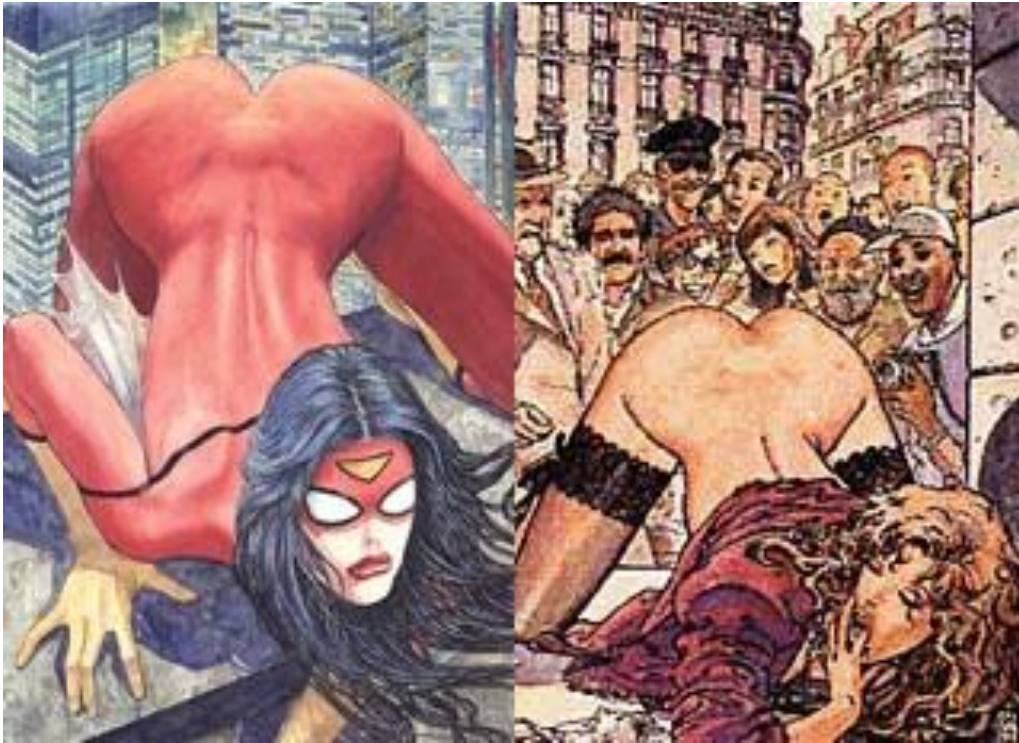
Ilustración II. Portada alternativa e imagen del interior del comic erótico Click!

superhéroes” 11 . Para dejar en claro cuán acertada es esta observación, podemos apreciar que Manara ya había dibujado, para su comic erótico Click! , una imagen casi idéntica a la de la portada de Spider-Woman :